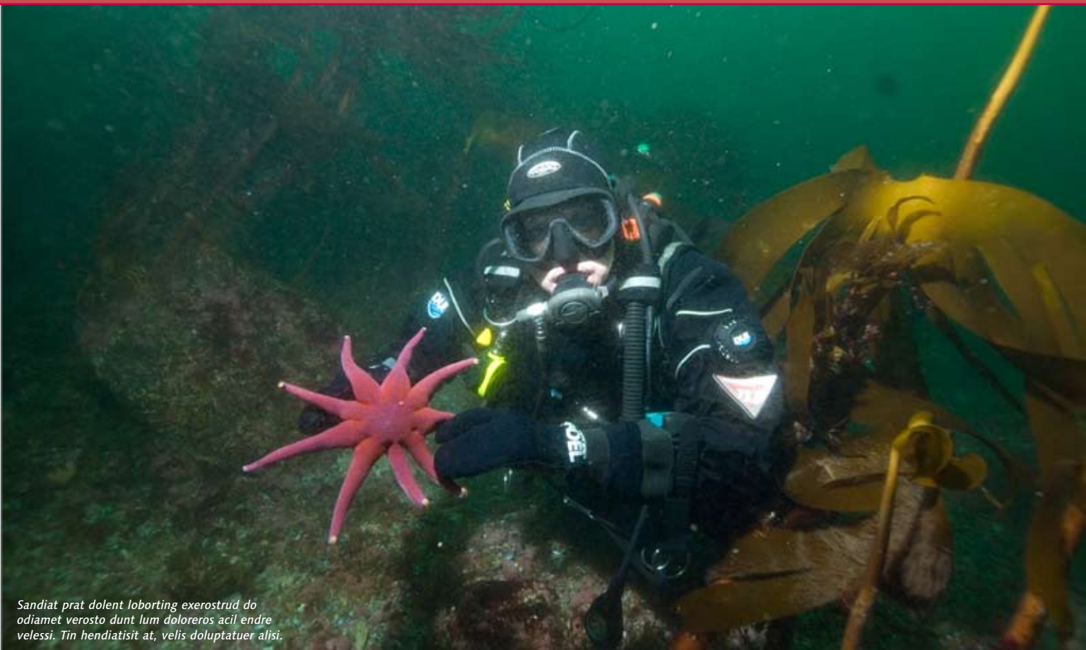
Sandiat prat dolent loborbing exerostrud do odiamet verosto dunt lum doloreros acil endre velessi. Tin hendiatisit at, velis doluptatuer alisi.