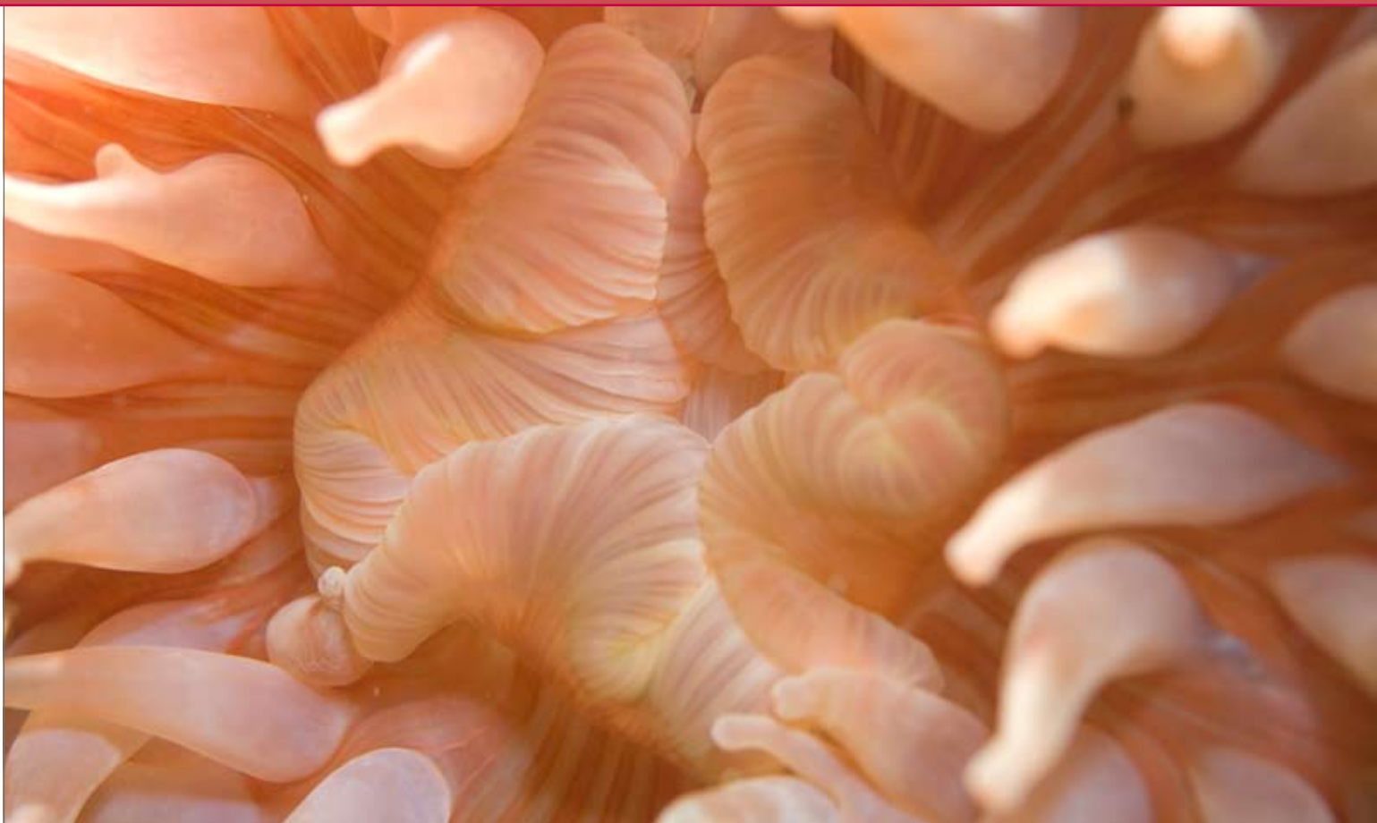
Sandiæt prat dolent loborting exerostrud do odiamet verosto dunt lum doloreros acil endre velessi. Tin hendiatisit at, velis doluptauer alisi.

både kan kun passere et par timer imellem ebbe og flod, da strømhvirvler på over ti meter ikke er et særsyn.