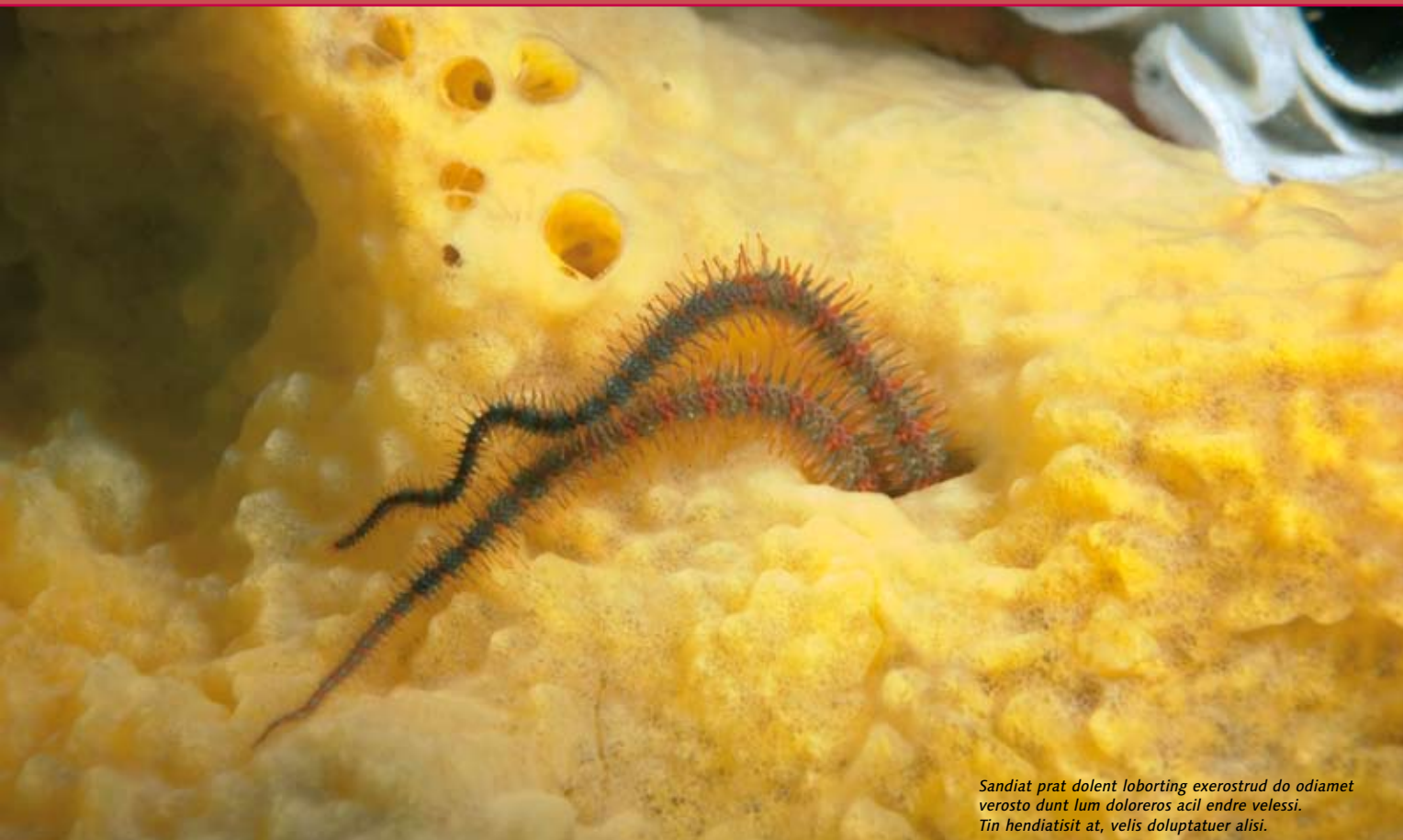
Sandiat prat dolent loborting exerostrud do odiamet verosto dunt lum doloreros acil endre velessi. Tin hendiatisit at, velis doluptatuer alisi.